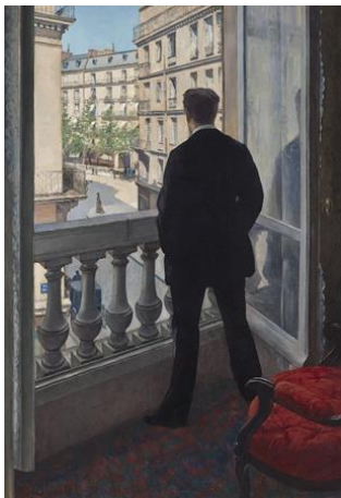
Jeune homme à sa fenêtre. 1876. J. Paul Getty Museum.

En effet il pratique de manière très scientifique et méticuleuse la préparation de chaque tableau, planifiant les lignes, transférant la scène dans une technique carré par carré pour rendre dans ses compositions la perspective spatiale de manière absolument saisissante, cherchant à rendre des effets de vues plongeantes, un effet presque photographique. Il était passionné par l'architecture et un grand admirateur de son contemporain le Baron Haussmann qui remodelait Paris, ses immeubles et ses grands boulevards.