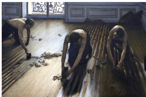
Les Raboteurs. 1875. Musée d'Orsay

L'exposition s'est ouverte au musée d'Orsay le 8 octobre 2024 jusqu'au 19 janvier 2025. Elle est organisée pour le 130 ème anniversaire de la mort de Caillebotte qui correspond également à la date du legs de son incroyable collection de peintures impressionnistes à l'État.